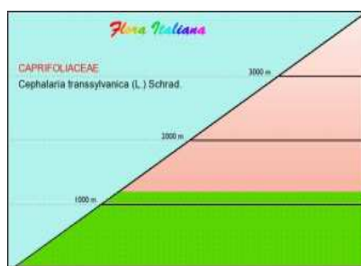
Distribuzione in altitudine della Vedovina