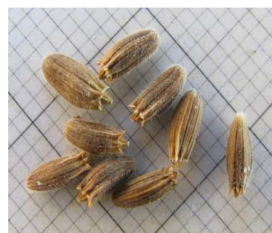
Semi di C. Transsylvanica