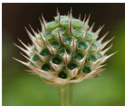
Cipsela di C. Transsylvanica