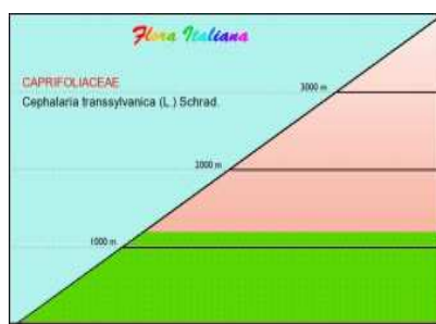
Distribuzione in altitudine della Vedovina