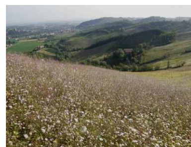
Campo con Vedovina