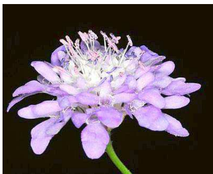
Fiore di C. Transsylvanica

A questo punto i semi sono disidratati, potete chiudere il barattolo avendo cura che conservi la chiusura ermetica e riporlo in frigorifero alla temperatura di 5°C. In questo modo i semi conservano un'alta percentuale di germinazione per un periodo indicativo di ca. 5 anni.